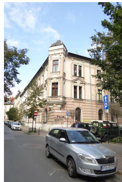
Rysunek 5 Przykładowy budynek ujęty w gminnej ewidencji zabytków pod adresem ul. Bonerowska 2/ ul. Librowszczyzna 5.