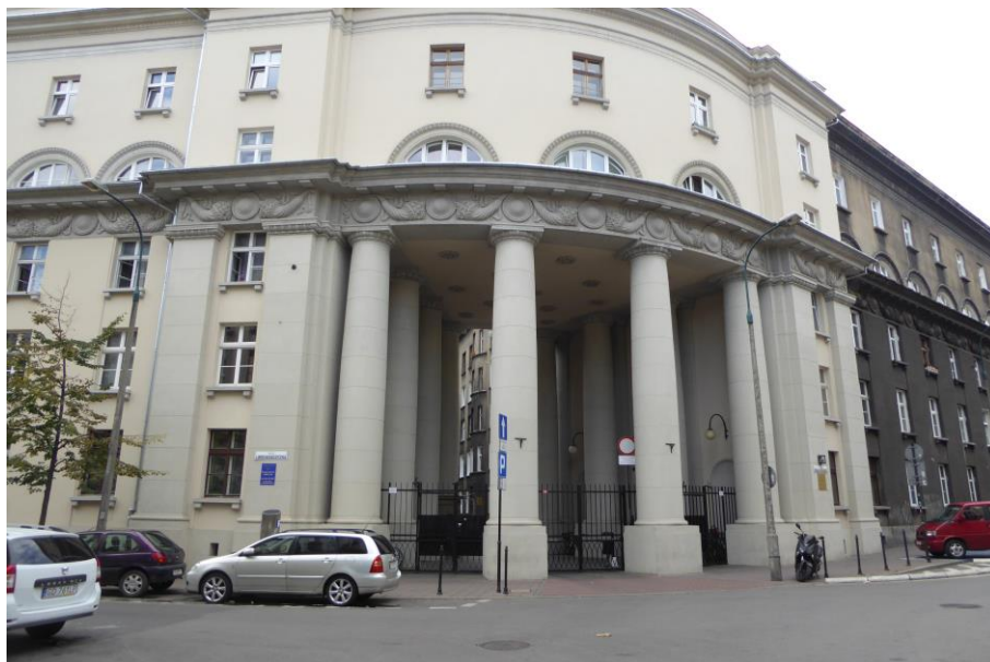
Rysunek 4 Przykładowy budynek wpisany do rejestru zabytków pod adresem ul. Zyblikiewicza 5 – dom pracowników Banku PKO.