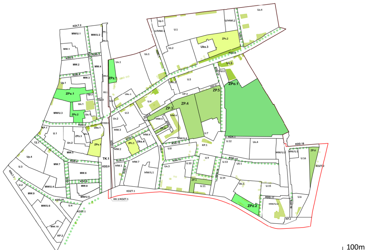
Rysunek 3 Schemat terenów zieleni, szpalerów drzew, stref szczególnie cennych przyrodniczo na rysunkach planów dla obszarów „Wesoła – Zachód” oraz „Wesoła – rejon ulicy Kopernika”.

Odnosząc się do gospodarowania wodami i ochrony gruntów rolnych i leśnych to na obszarze planu nie występują obszary rolne i leśne, a pod obszarem planu nie ma chronionych zbiorników wodnych.