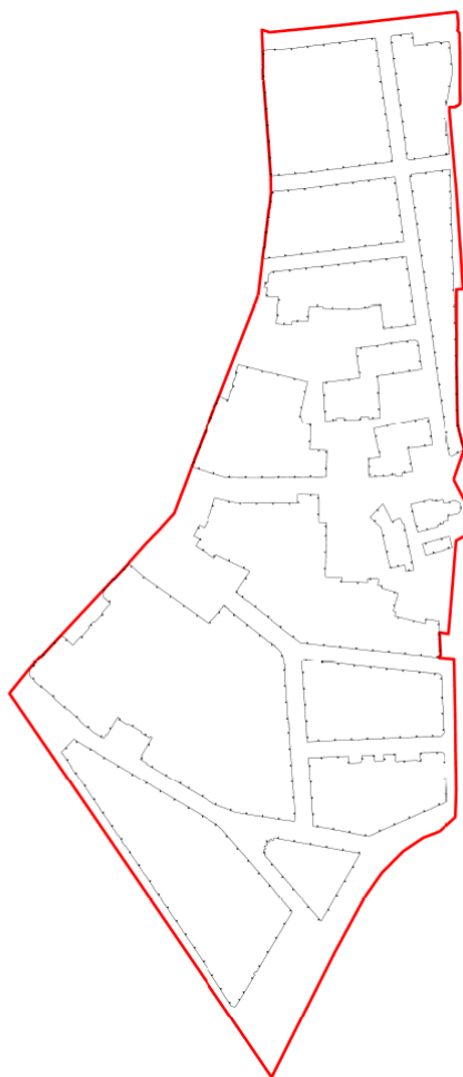
Rysunek 1 Obowiązujące i nieprzekraczalne linie zabudowy, wyznaczone w projekcie planu, tworzące zwarte i regularne kwartały zabudowy.

Plan ustala możliwość lokalizacji budynków bezpośrednio przy granicy z sąsiednią działką budowlaną, w nawiązaniu do aktualnie zagospodarowanych działek budowlanych na Wesołej. Ponadto plan ustala, że cały obszar planu stanowi obszar zabudowy śródmiejskiej, co pozwoli na kontynuację obecnego intensywnego charakteru zabudowy centrum historycznego miasta.