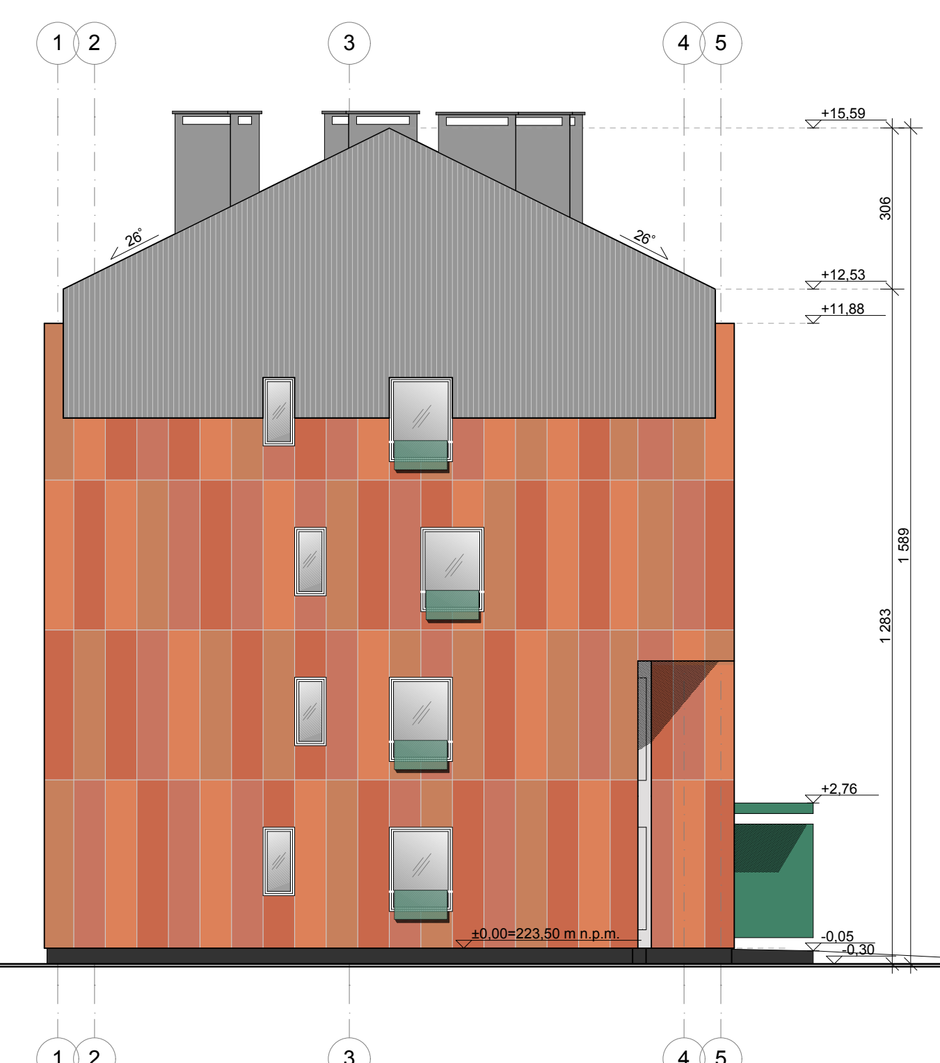
C1 elewacja południowa