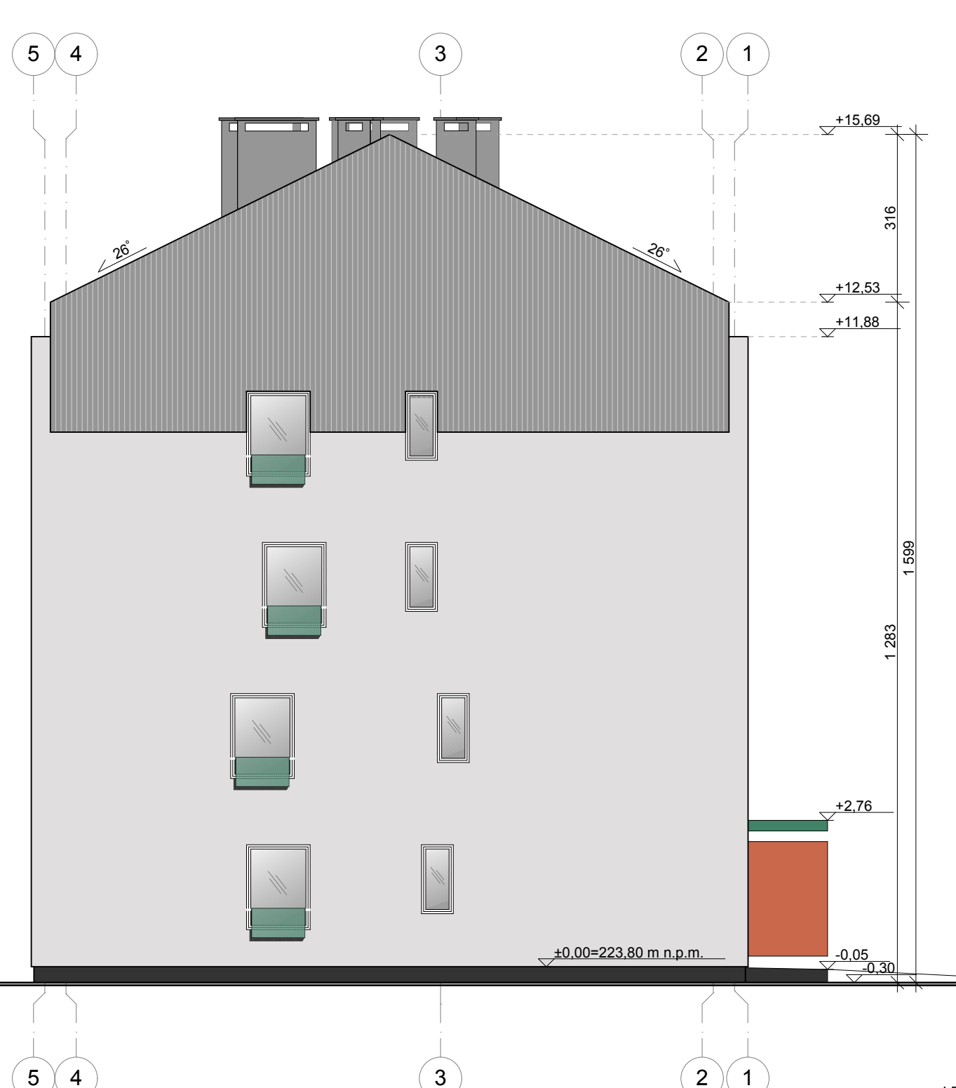
C2 elewacja północna - FRONTOWA