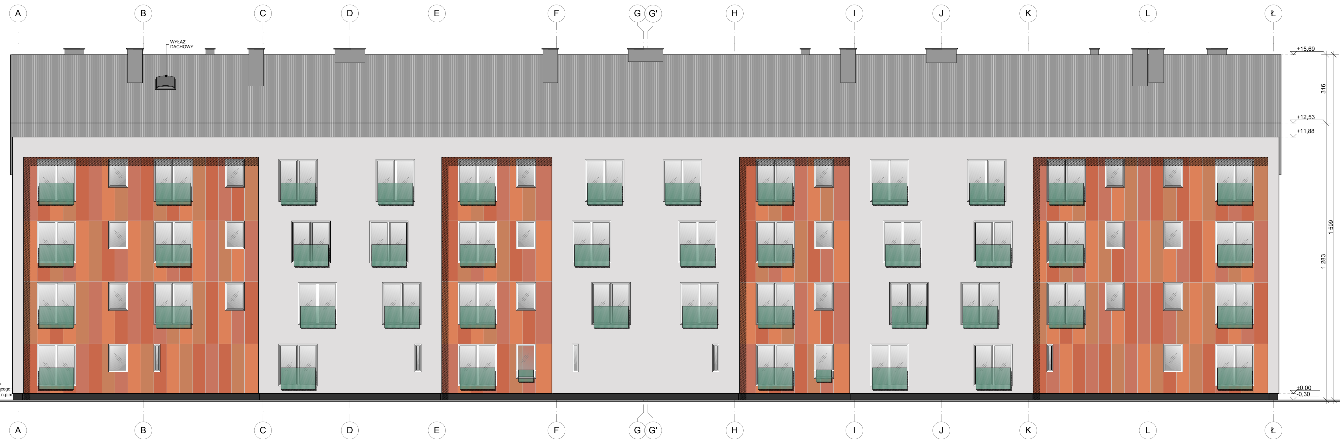
C2 elewacja wschodnia