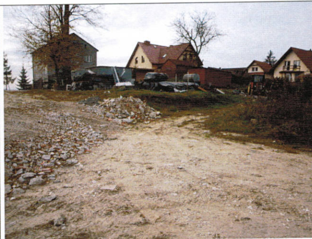
Skarpa główna osuwiska