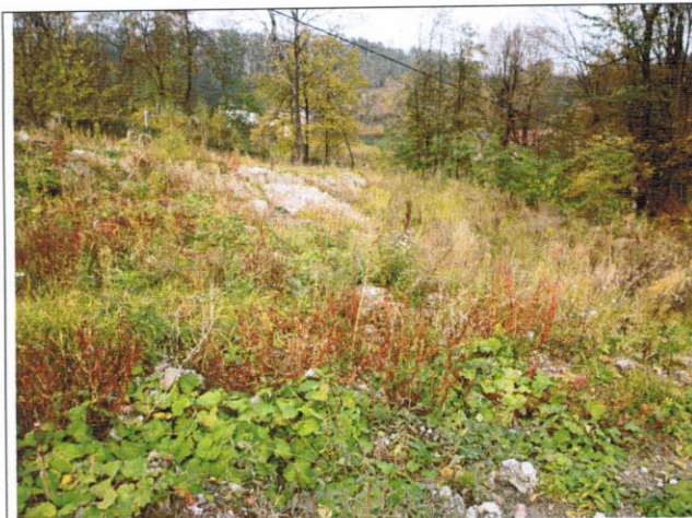
Dolna część osuwiska ze skarpy wtórna