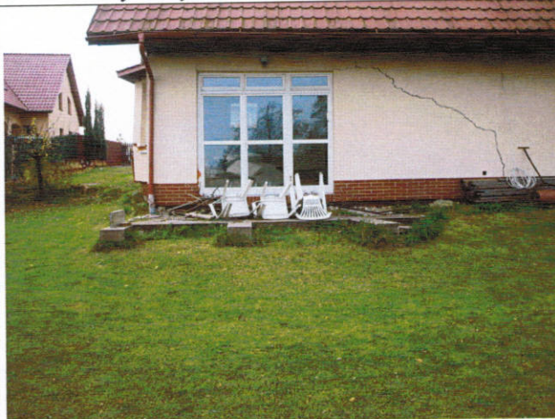
Budynek ze skarpą