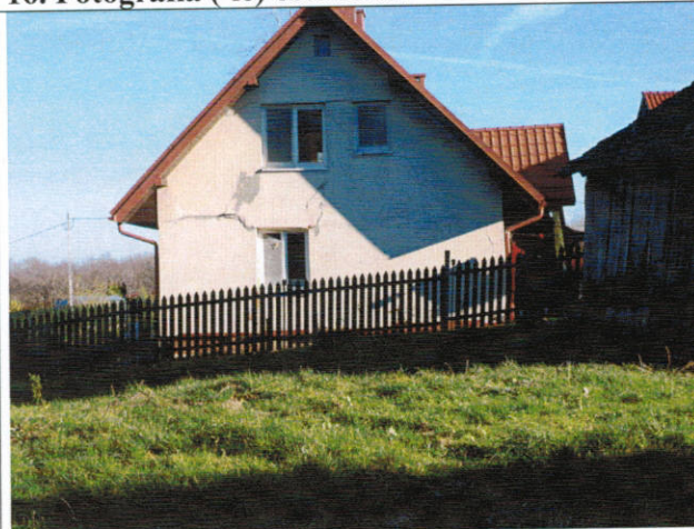
Uszkodzony budynek mieszkalny (widok z boku)