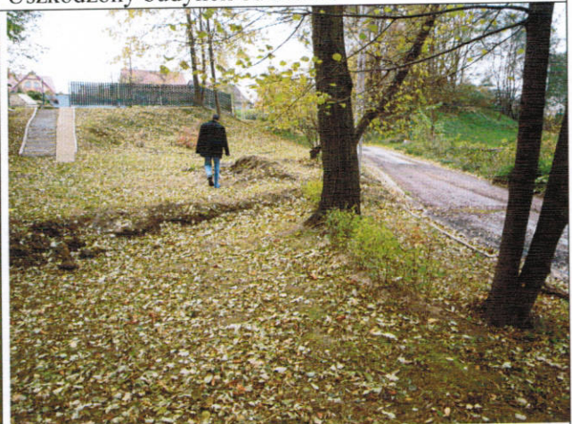
skarpa z nasunięcia