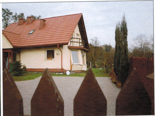
Uszkodzony budynek od frontu