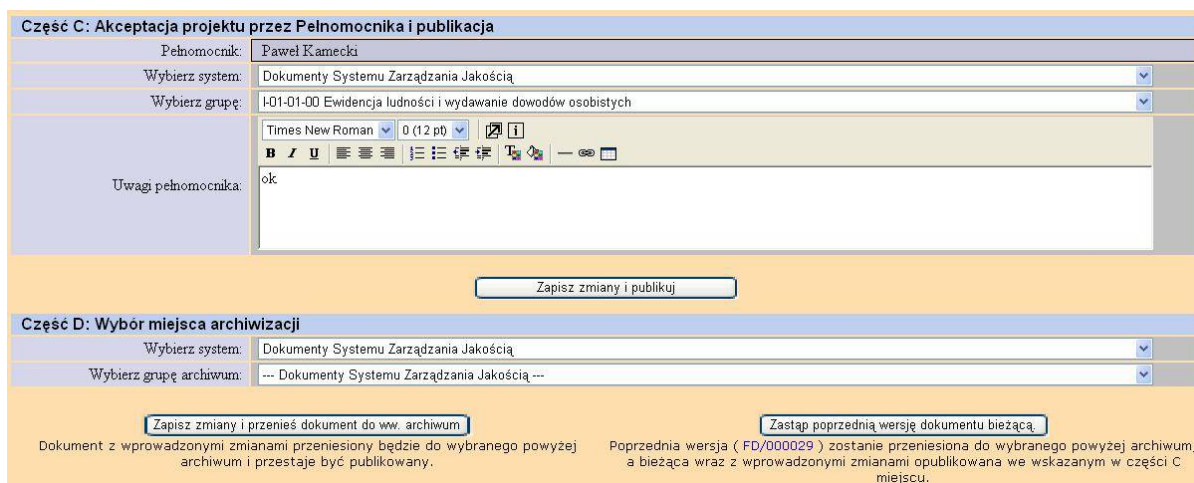
Rysunek 2 Zastąpienie dokumentu bieżącego nową wersją dokumentu

Opcje te przedstawiono na poniższym rysunku: