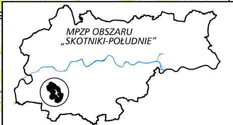
MPZP OBSZARU „SKOTNIKI-PÓŁDNIĘ”