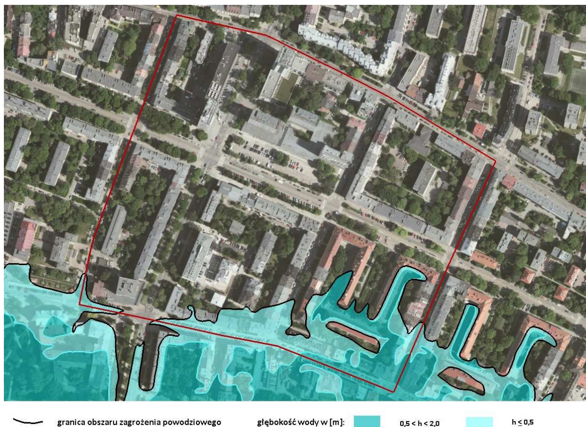
Ryc. 3. Mapa zagrożenia powodziowego wraz z głębokością wody. Tereny w granicach obszaru opracowania, narażone na zalanie w przypadku zniszczenia lub uszkodzenia wału przeciwpowodziowego, przy przyjętym przepływie o średnim prawdopodobieństwie wystąpienia powodzi wynoszącym raz na 100 lat ( Q 1\% ).

W obszarze opracowania nie zinwentaryzowano ani nie udokumentowano terenów zagrożonych lub objętych ruchami masowymi [49], a możliwość wystąpienia procesów dynamicznych i zagrożeń z nimi związanych jest ograniczona ze względu na generalnie płaskie ukształtowanie terenu. W związku z tym najważniejszym zagrożeniem naturalnym pozostaje niebezpieczeństwo powodzi, na które narażona jest południowa i południowo-wschodnia część obszaru opracowania (Ryc. 3).