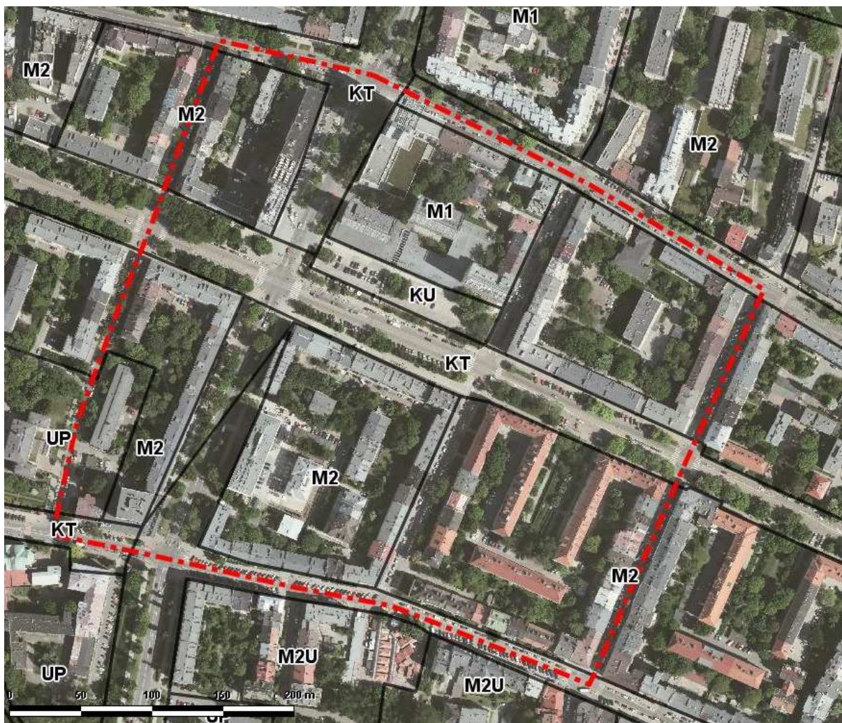
Ryc. 2. Przeznaczenia terenów w Miejscowym Planie Ogólnym Zagospodarowania Przestrzennego Miasta Krakowa z 1994 r.