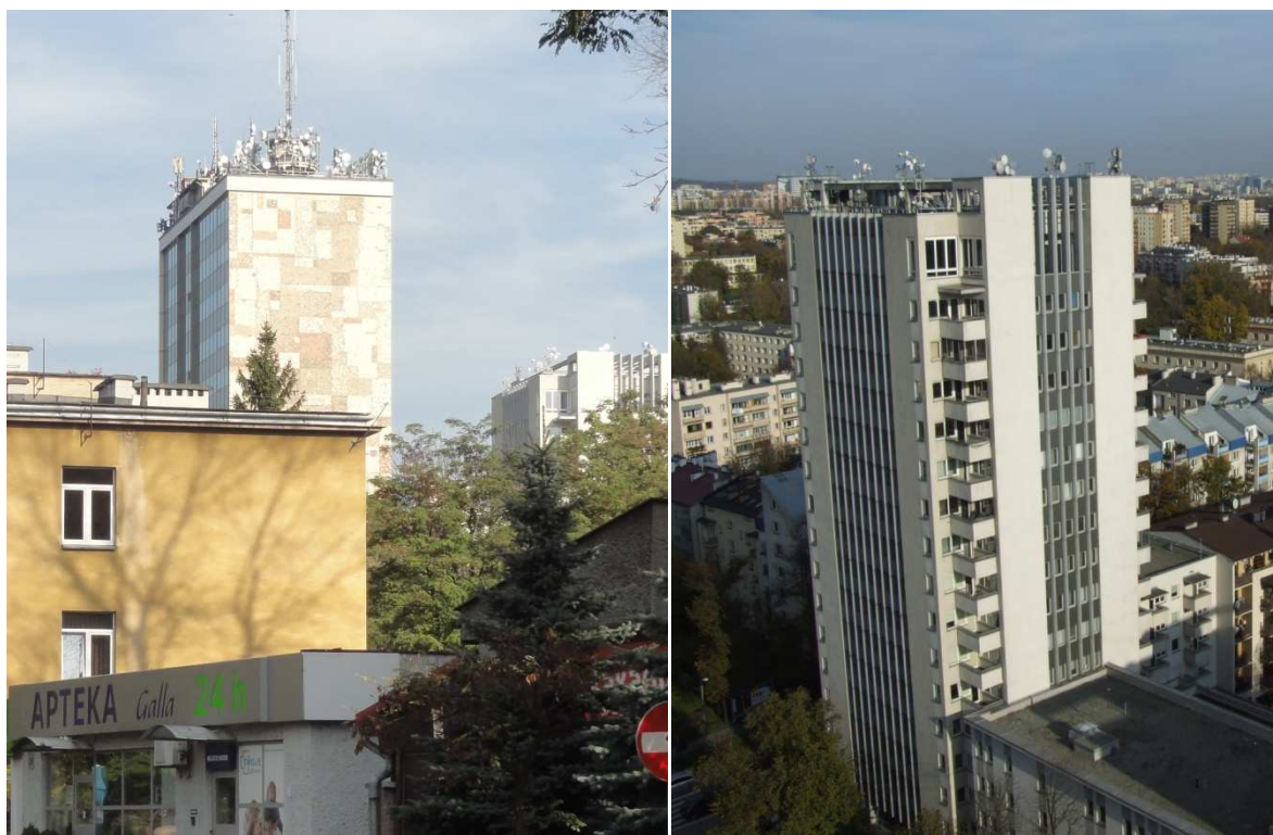
Fot. 1. Widoczne liczne urządzenia łączności na dachu Biprostalu oraz wieżowca przy skrzyżowaniu al. Kijowskiej oraz ul. Kazimierza Wielkiego.

Podstawowym założeniem obserwacji zmian wielkości opisujących pola elektromagnetyczne jest ochrona ludności przed wzrostem poziomów pól elektromagnetycznych ponad wartości dopuszczalne, określone dla terenów przeznaczonych pod zabudowę mieszkaniową i miejsc dostępnych dla ludności, w rozporządzeniu Ministra