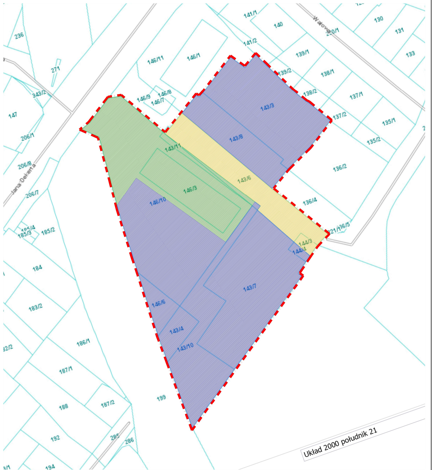
PLAN SYTUACYJNY SKALA 1:1000