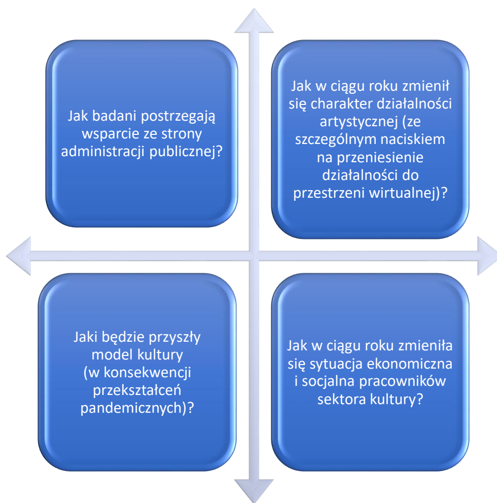
Diagram 1. Pytania badawcze.

Cele badań zostały zrealizowane poprzez odnalezienie odpowiedzi na cztery główne pytania badawcze, które dotyczyły sytuacji ekonomicznej i socjalnej respondentów, charakteru ich działalności zawodowej, wsparcia ze strony administracji publicznej oraz kształtu kultury po pandemii covid-19.