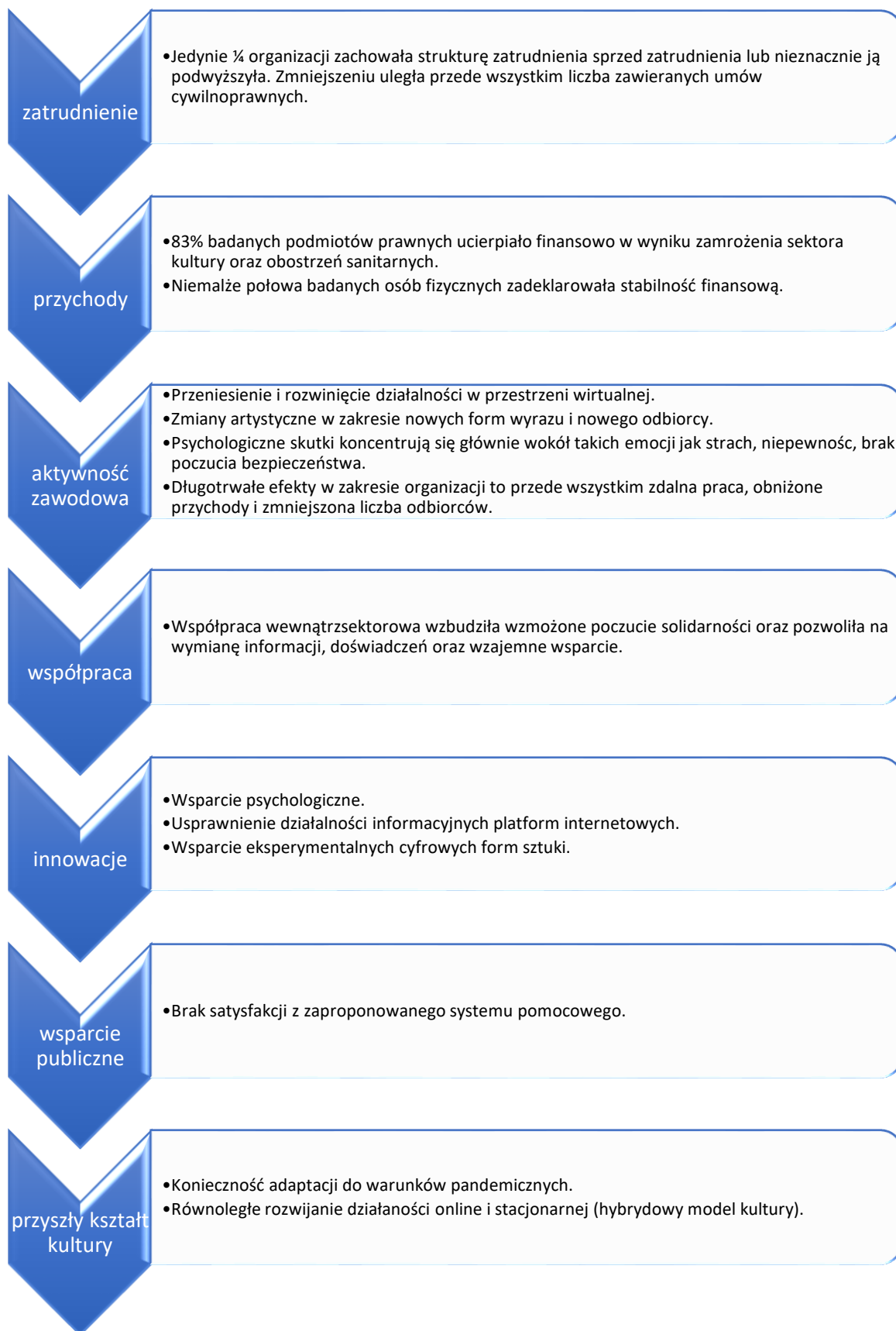
Diagram 2. Główne wnioski z badań.