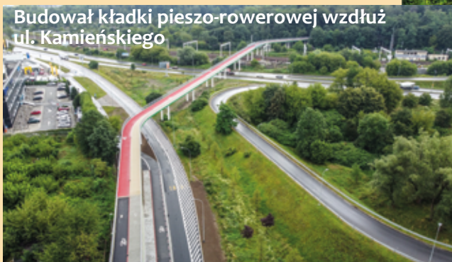
Budowa kładki pieszo-rowerowej wzdłuż ul. Kamieńskiego