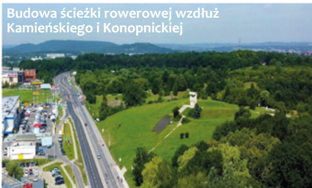
Budowa ścieżki rowerowej wzdłuż Kamieńskiego i Konopickiej