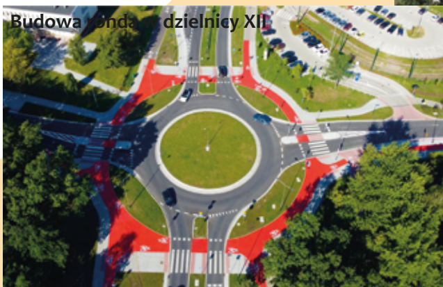
Budowa ronda w dzielnicy XII