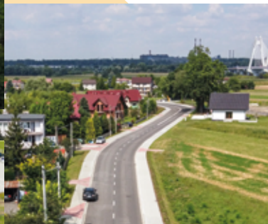
Rozbudowa ul. Wroblela