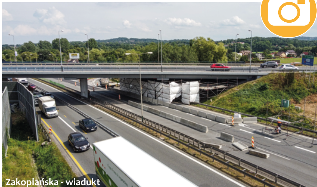
Zakopiańska - wiadukt