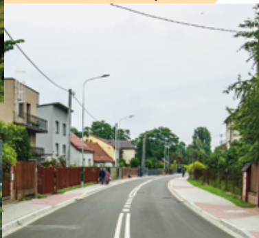
Przebudowa ul. Bieżanowskiej