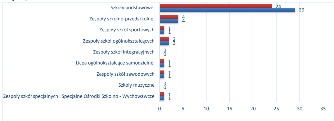
Wykres nr 2. Liczba gabinetów stomatologicznych w poszczególnych typach szkół i placówek Gminy Miejskiej Kraków w 2018 roku.

Opracowanie: Referat ds. Zdrowia Wydziału Polityki Społecznej i Zdrowia