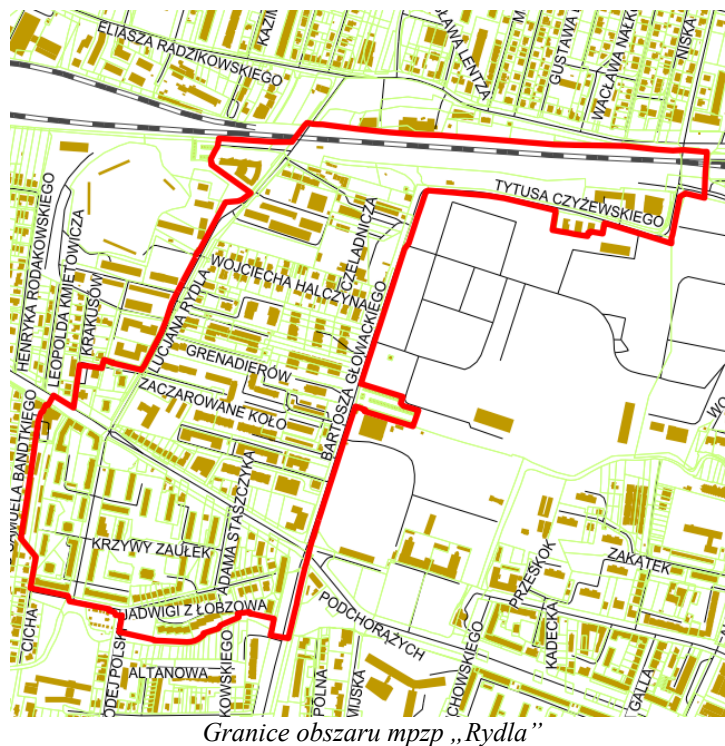
Tabela 1. Bilans terenów w obszarze mpzp „Rydla”