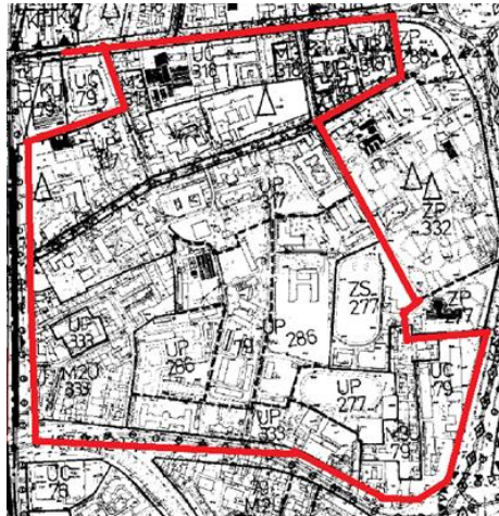
Przeznaczenia nieobowiązującego Miejscowego Planu Ogólnego Zagospodarowania Przestrzennego Miasta Krakowa

W planie ogólnym na większości obszaru występują przeznaczenia UP i UC tj. usług publicznych oraz usług komercyjnych, zgodnie z faktycznym użytkowaniem obiektów i terenów. Jako usługi publiczne wyznaczono np. tereny Straży Pożarnej czy Obiekty Szpitalne. Przeznaczenie pod usługi komercyjne otrzymały tereny fabryki Żółkiewskiego, Dom Turysty, czy obiekty przy ulicy Lubicz. Jedną dużą zmianę funkcjonalną można zauważyć obecnie dla obiektu Banku PKO zlokalizowanego przy ulicy Wielopole, który w planie z 1994 miał przeznaczenie Usług Publicznych, a obecnie jest przerabiany na komercyjny hotel.