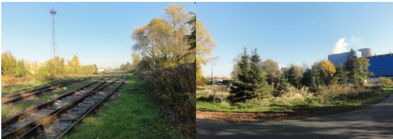
Fot. 1. Zieleń w południowej części obszaru.