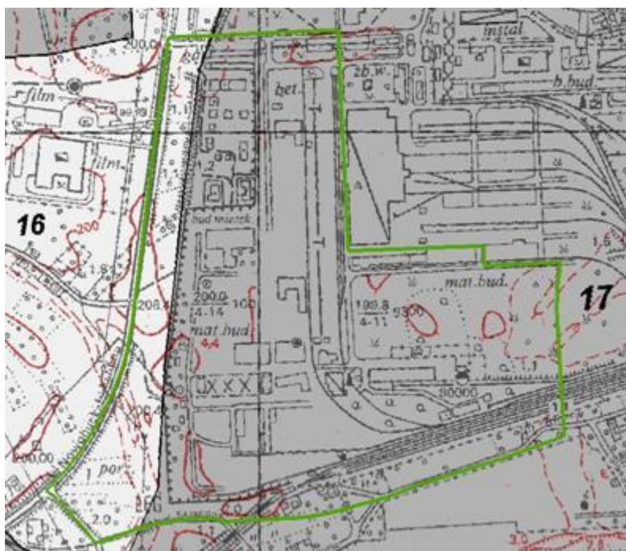
Ryc. 2. Jednostki glebowe i ich rozmieszczenie na analizowanym obszarze (16 – tereny zabudowane oraz gleby urbanoziemne i gleby ogrodowe; 17 – gleby zmienione przez przemysł) [17].

Utwory te zajmują znaczące powierzchnie w Nowej Hucie, stanowią większość gleb w obszarze opracowania.