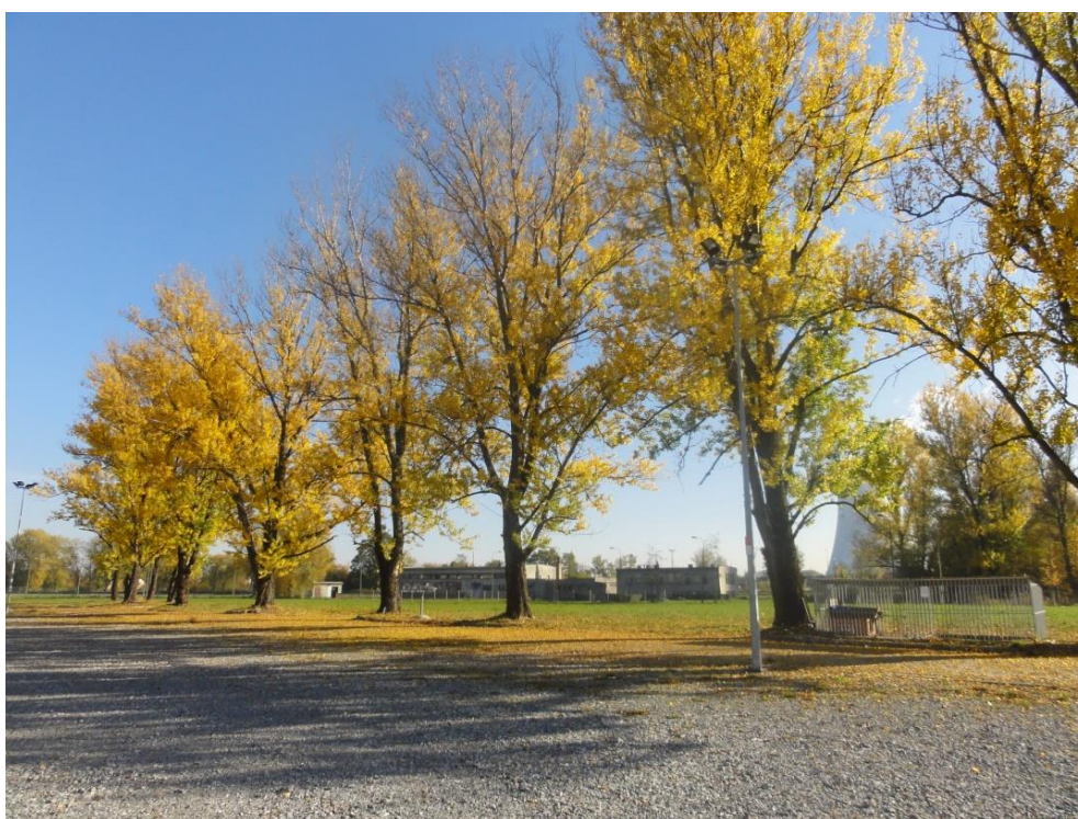
Fot. 2. Wyróżniający się szpaler topoli (zlokalizowany na południe od centrum targowo-kongresowego).