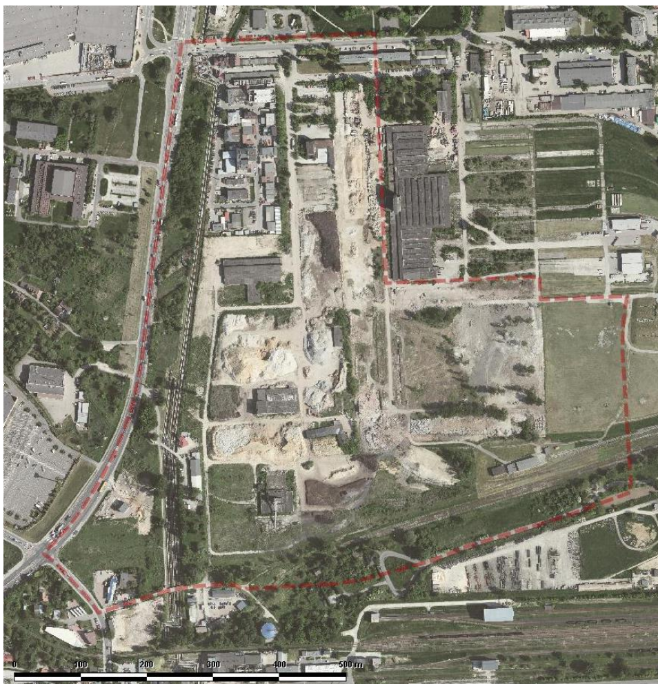
Ryc. 1. Położenie obszaru opracowania na tle terenów sąsiednich (stan na 2013 r. [21]).

Większość obszaru znajduje się w zasięgu obowiązującego miejscowego planu zagospodarowania przestrzennego „Czyżyny – Łęg”, który obowiązuje od dnia 13 października 2013 r.