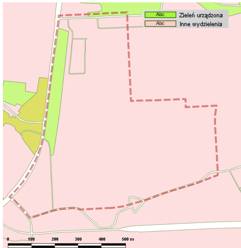
Ryc. 3 Roślinność rzeczywista obszaru „Czyżyny – Rejon ulicy Galicyjskiej” [15]

Większość obszaru „Czyżyny – Rejon ulicy Galicyjskiej” stanowią tereny zainwestowane (zgodnie z przedstawionym fragmentem „Mapy roślinności rzeczywistej”). W niewielkim stopniu na omawianym obszarze występuje zieleń urządzona. Poniżej przedstawiono krótką charakterystykę wydzielonych zbiorowisk roślinności rzeczywistej.